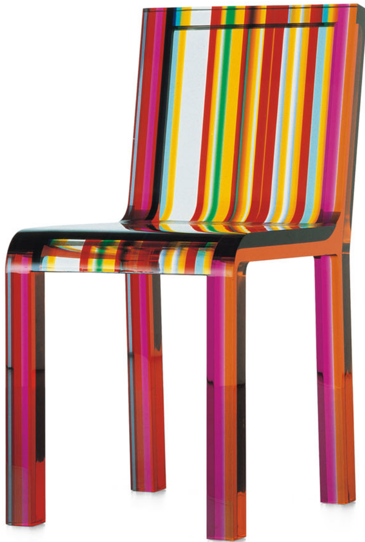
RAINBOW CHAIR Patrick Norguet 2000