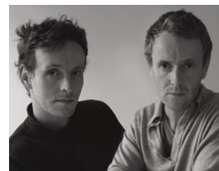
by M. Le Gall

Nés en France dans les années 70, ils commencent à s'occuper de design avec un premier travail important pour Issey Miyake en 2000. En quelques années, deux monographies, le "Catalogue de Raison" et la publication successive de Phaidon en 2003, recueillent les images de leur travail. Les frères Bouroullec sont considérés parmi les nouvelles étoiles du monde du design, jeunes et rigoureux, réfléchis et en même temps passionnés ; leurs projets sont des véritables «microarchitectures», qui peuvent être utilisées pour différentes fonctions, et pour caractériser et faire varier les espaces où ils sont placés.