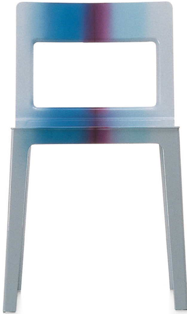
HOLE Ronan Bouroullec 2000