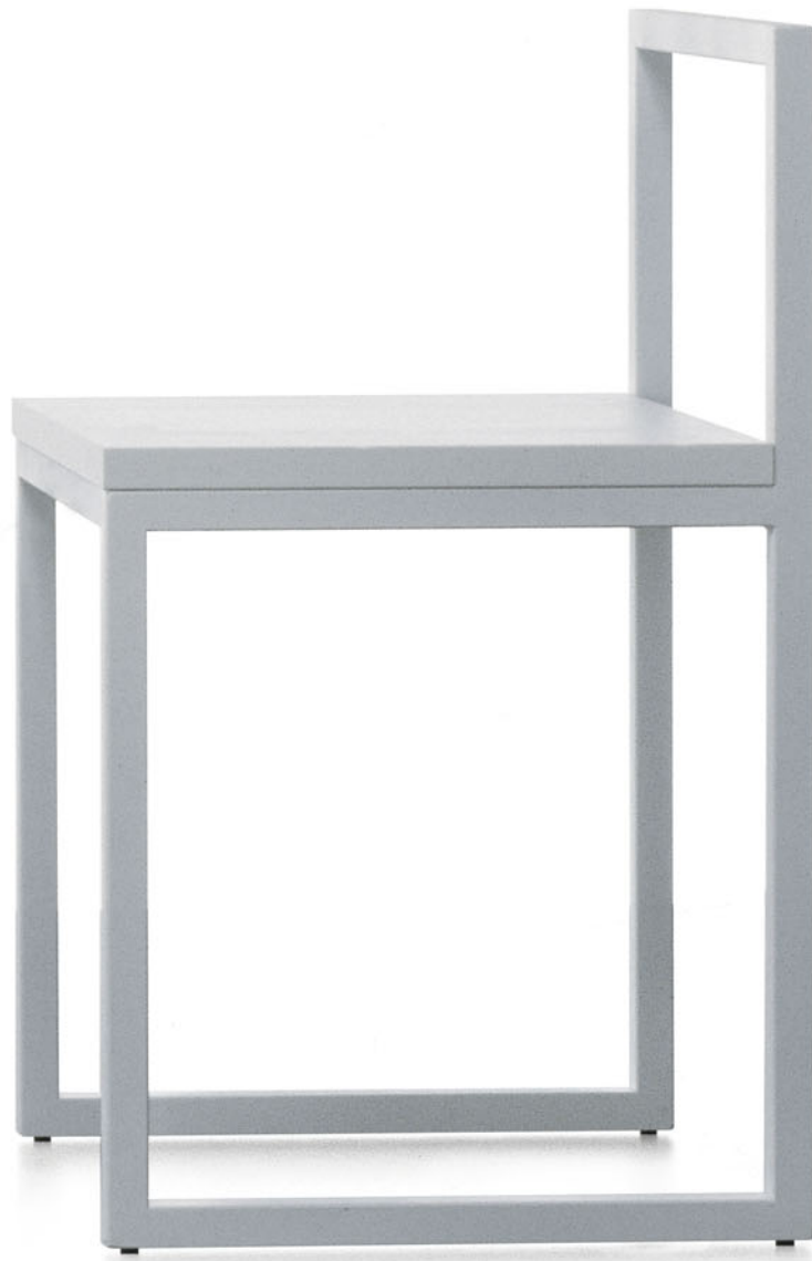
FRONZONI '64 A.G. Fronzoni 1964