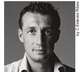
by C.Estevés Ribas

Serie di contenitori disponibili laccati macroter in tutti i colori di collezione, in rovere naturale o in wengé. Il contenitore con cassetti bar può essere dotato di un portabottiglie in alucobond. Piedini in alluminio nella finitura nickel satinato.