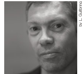
by L. Galbring

Serie di tavoli bassi rettangolari smontabili, sovrapponibili e componibili fra loro. Piano a doghe in legno massello di rovere naturale, gambe smontabili in rovere naturale tornito. I top presentano impronte circolari per sovrapporre i diversi elementi.