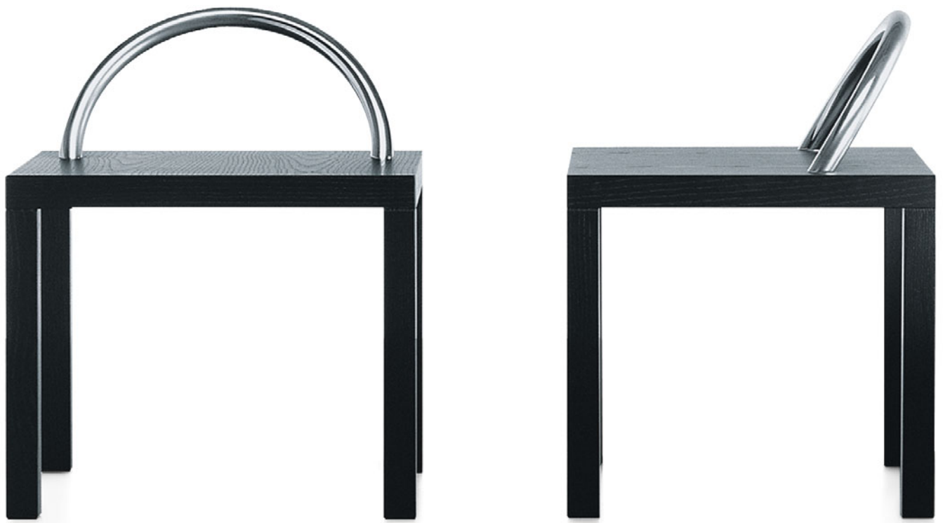
KO-KO Shiro Kuramata 1986