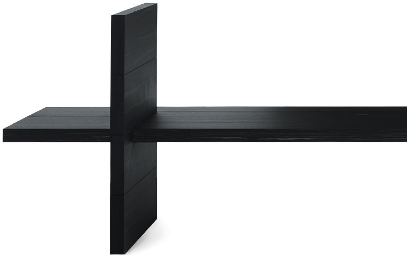
WATERSIDE Claudio Silvestrin 2001