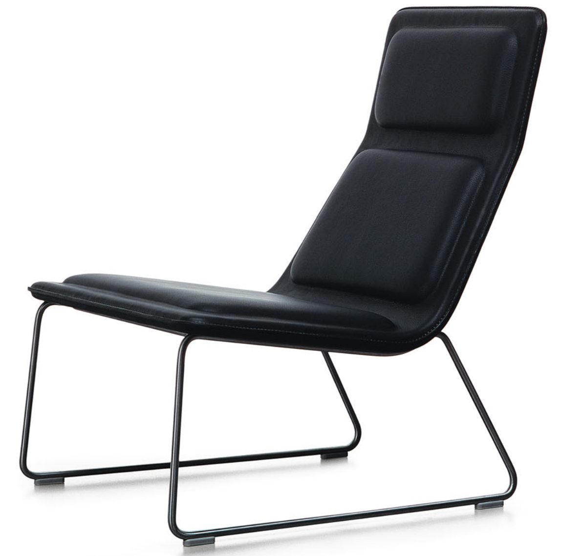
LOW PAD Jasper Morrison 1999/2002