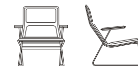
LW/2 cm. 74,5x70,5x35/75h. inch 29,25x27,75x13,75/29,50h.

Poltroncina con o senza braccioli, scocca in multistrato di legno imbottita in poliuretano espanso a quote differenziate. Rivestimento fisso nei tessuti e pelli di collezione. Gambe in acciaio inox satinato, piedini in gomma.