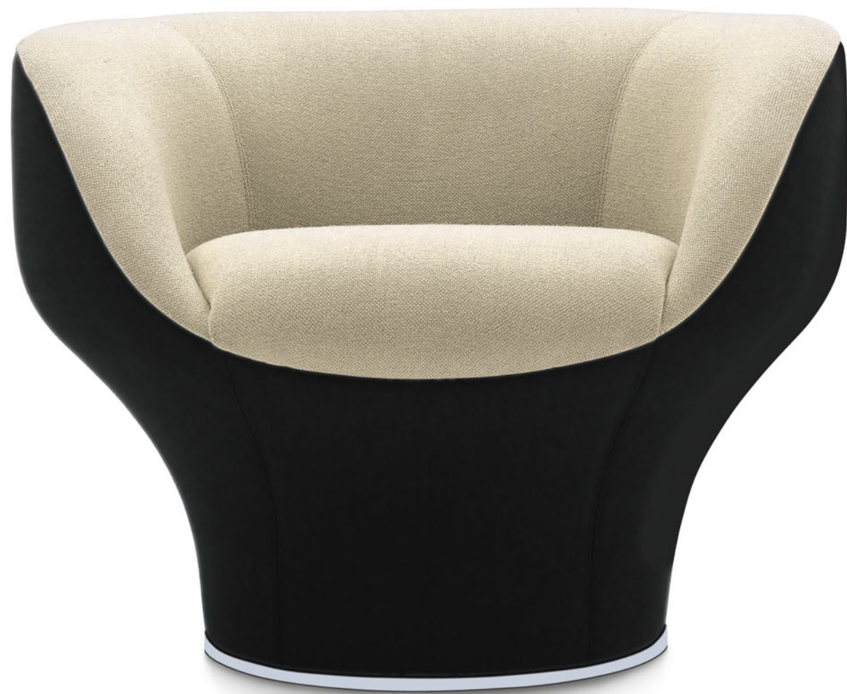
IGLOO Eero Koivisto 2005