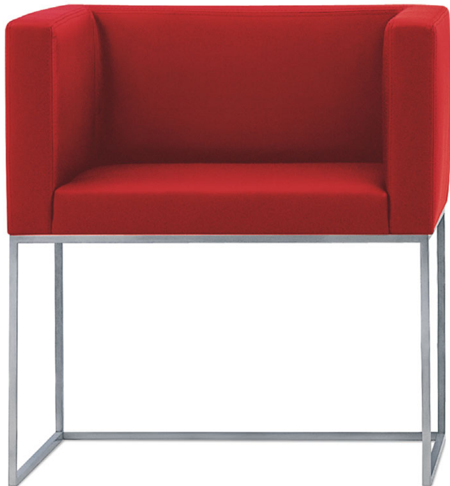
EXTRARMCHAIR Fabien Baron 2001