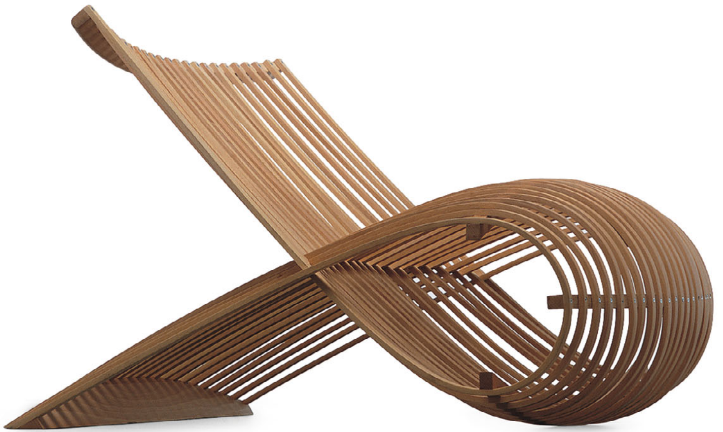
WOODEN CHAIR Marc Newson 1992