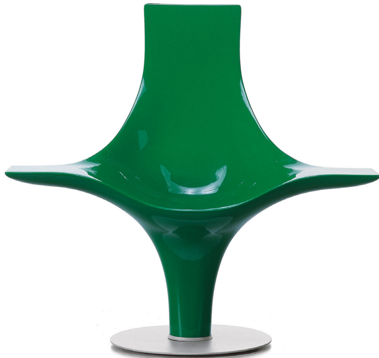
STATUETTE Lloyd Schwan 1995