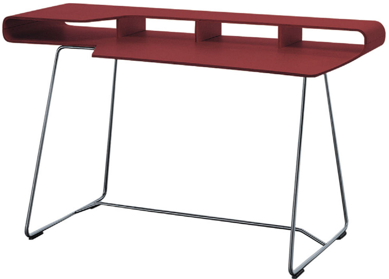
LOOP Barber Osgerby 1998