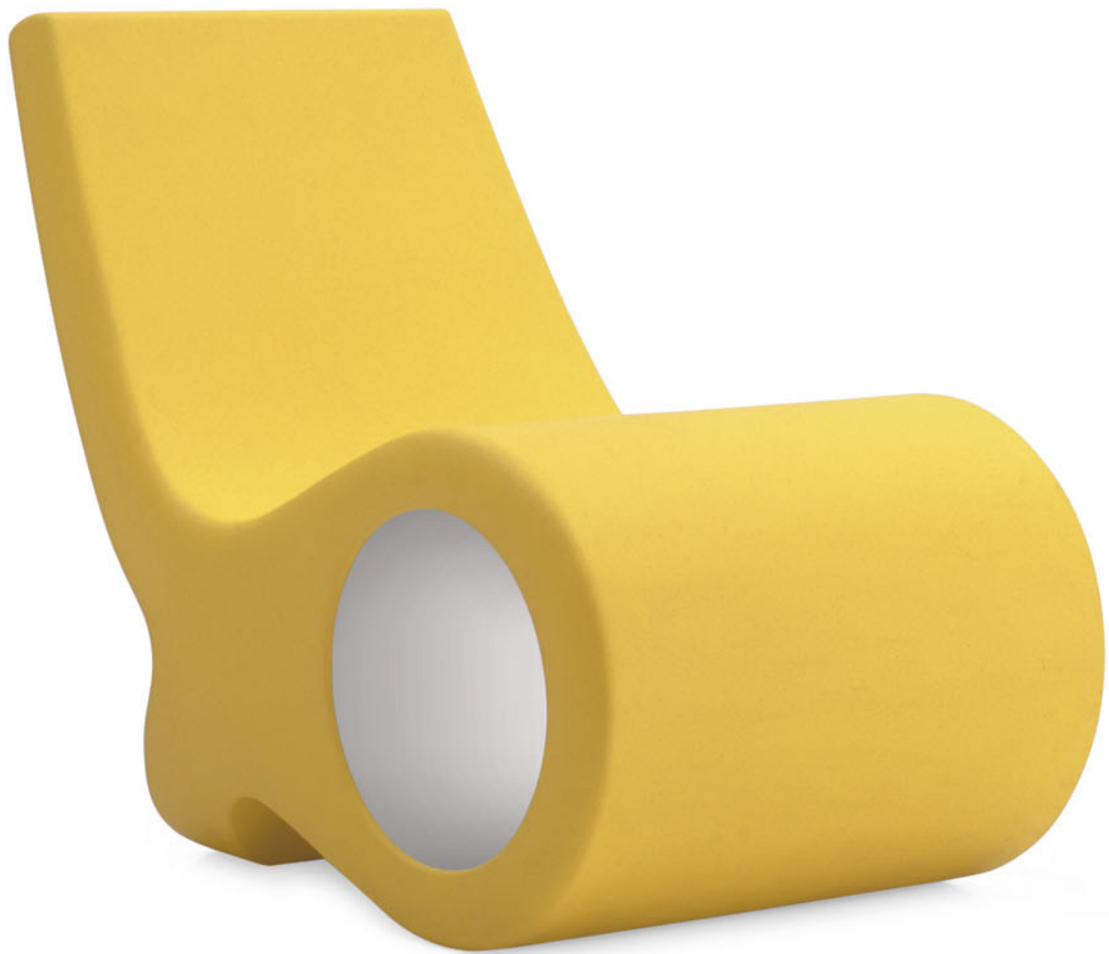
FISH CHAIR Satyendra Pakhalè 2005