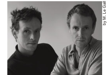
by M. Le Gall

Nés en France dans les années 70, ils commencent à s'occuper de design avec un premier travail important pour Issey Miyake en 2000. En quelques années, deux monographies, le "Catalogue de Raison" et la publication successive de Phaidon en 2003, recueillent les images de leur travail. Les frères Bouroullec sont considérés parmi les nouvelles étoiles du monde du design, jeunes et rigoureux, réfléchis et en même temps passionnés; leurs projets sont des véritables «microarchitectures», qui peuvent être utilisées pour différentes fonctions, et pour caractériser et faire varier les espaces où ils sont placés.