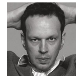
by G. Hart

Chaiselongue mit Wippeffekt mit abnehmbaren Bezug in Stoffen und Ledern der Kollektion.